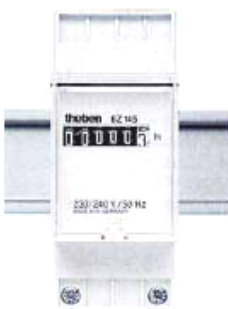
BZ 142-3 со штекерным цоколем